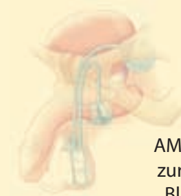
AMS 800™ System zur Kontrolle der Blasenfunktion

Nachdem das AMS 800 System implantiert und aktiviert wurde, kontrollieren Sie den Zeitpunkt Ihres Harnabgangs, indem Sie eine im Hodensack implantierte Pumpe betätigen. Das AMS 800 System mit Doppelmanschette wird am häufigsten bei Männern mit schwerer Inkontinenz verwendet.