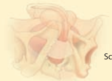
InVance® Schlingensystem für Männer

Das InVance System bietet eine effektive Behandlung für Patienten mit leichter bis mittlerer Inkontinenz.